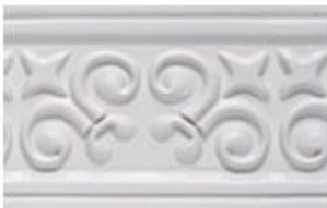
FLORENCIA L 245 cm E 1.5 cm A 12.5 cm