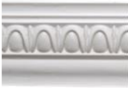
DMI – 82100 L 245 cm E 1.5 cm A 10 cm