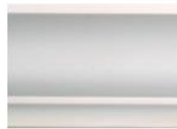
DMI – 12105 L 245 cm E 1.5 cm A 10.5 cm