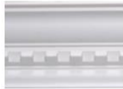
DMI – 8092 L 245 cm E 1.5 cm A 9.2 cm