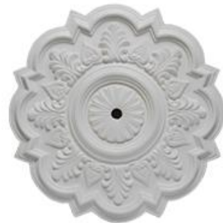
J Nápoles Diámetro 50 cm