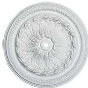
A Imperia Diámetro: 40 cm