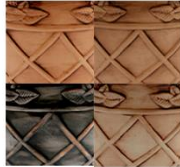
Padua Color Nogal Americano