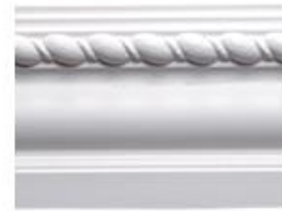
DMI – 8190 L 245 cm E 1.5 cm A 9 cm