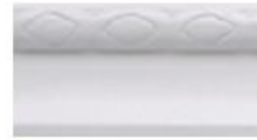
DMI – 5430 L 245 cm E 1.5 cm A 3 cm