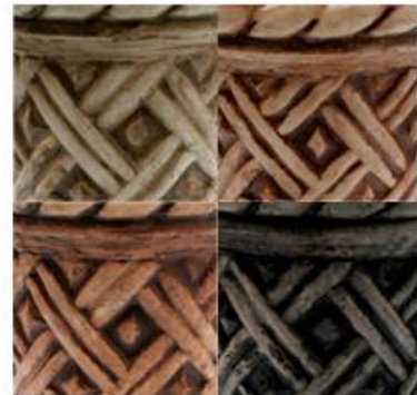
Roble Claro Musgo