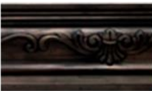
ESCOCIA Cenere L 245 cm E 3 cm A 19.5 cm