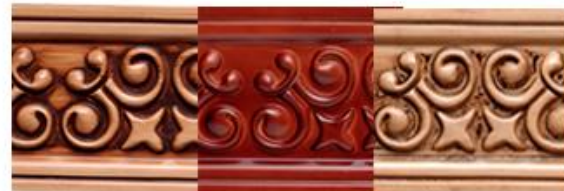
MAPLE CAOBA ROBLE