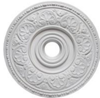
N Parma Diámetro 36 cm