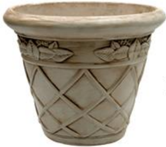
Bologna Color Nogal Americano

Medidas: Diámetro Superior 41 cm Diámetro Inferior 21.5 cm Altura 31.5 cm