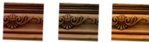
MAPLE MIELLE ROBLE