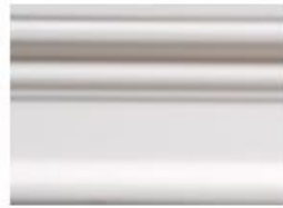
DMI – 1182 L 245 cm x E 1.5 cm A 8.2 cm