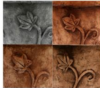
Macerata Color Nogal Americano