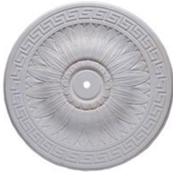
B Bari Diámetro 50 cm