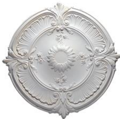
E Roma Diámetro 70 cm