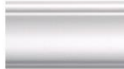
DMI – 1065 L 245 cm E 1.5 cm A 6.5 cm