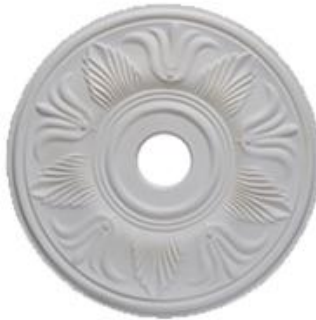
M Génova Diámetro: 50 cm